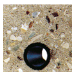
CAF mit hohlraumfreier Heizrohrummantelung und somit störungsfreiem Wärmeübergang

Durch so genanntes „Schwabbeln“ mit der Schwabbelstange wird der CAF entlüftet und bei der Nivellierung unterstützt. Es entstehen ebene, raumstabile (schüsselfreie) Oberflächen. Auf Fugen kann weitestgehend verzichtet werden. Aufgrund der hohen Druck- und Biegezugfestigkeiten (CAF C20 F4 oder CAF C30 F5) kann selbst unter keramischen oder Naturstein-Bodenbelägen auf Bewehrung in Form von Gittermatten oder Fasern verzichtet werden.